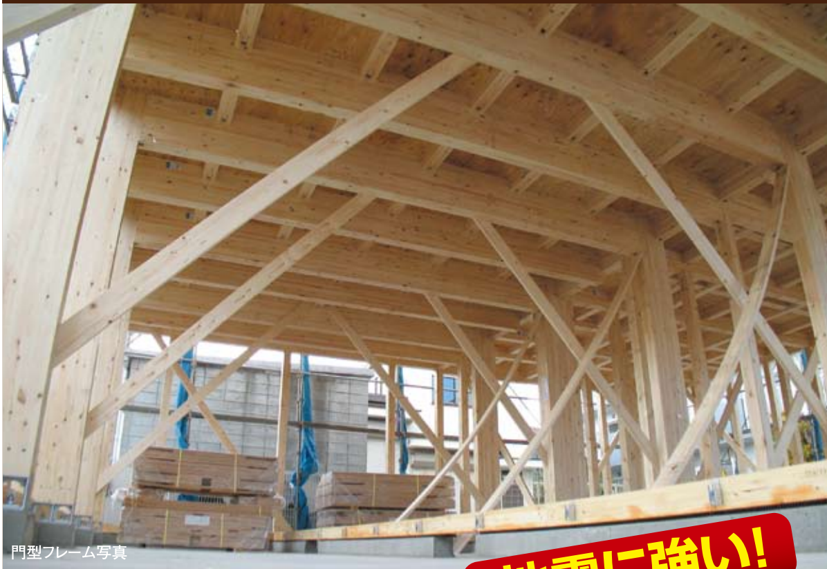
門型フレーム写真

AM10:00～PM5:00 当日はお気軽に現地までお越しください。ご希望の方には近隣の完成現場もご覧いただけます。